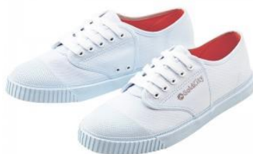
รองเท้าพละสีขาวล้วน