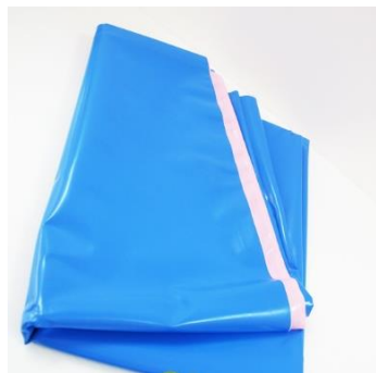
ผ้ายารองกันเปื้อนที่นอน