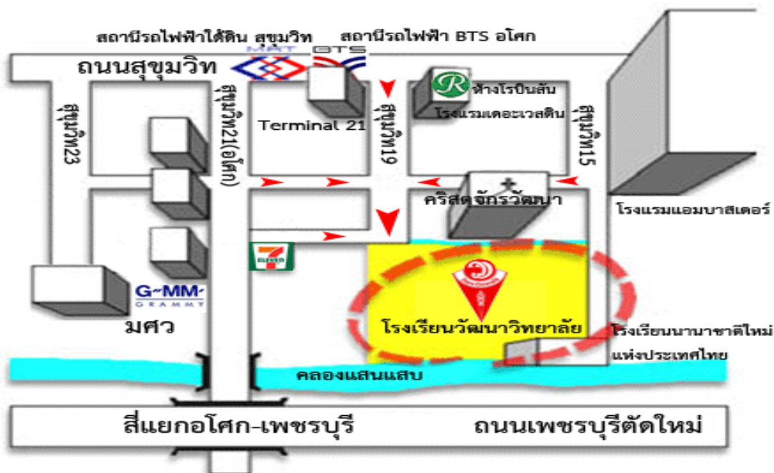
แผนภาพ สถานที่ตั้งโรงเรียนวัฒนาวิทยาลัย