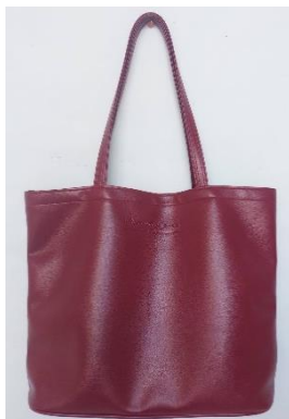
กระเป๋าใส่หนังสือของโรงเรียน