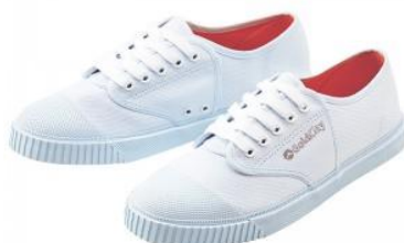
รองเท้าพละสีขาวล้วน