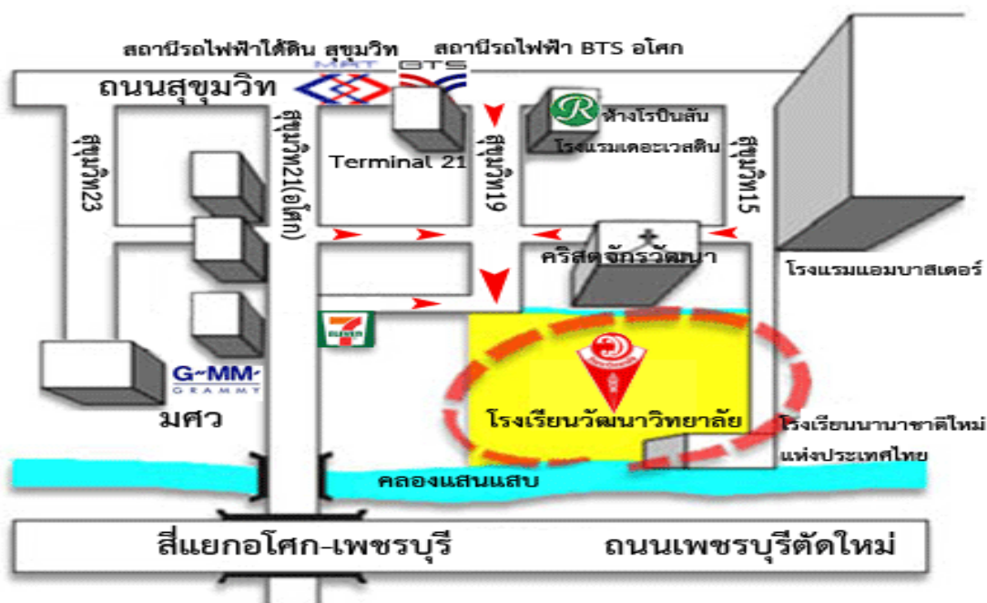
แผนภาพ สถานที่ตั้งโรงเรียนวัฒนาวิทยาลัย