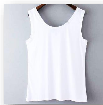
ชุดชั้นในและเสื้อทับสีขาวล้วน