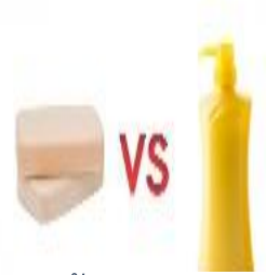
สบู่อ่อน สบู่เหลว