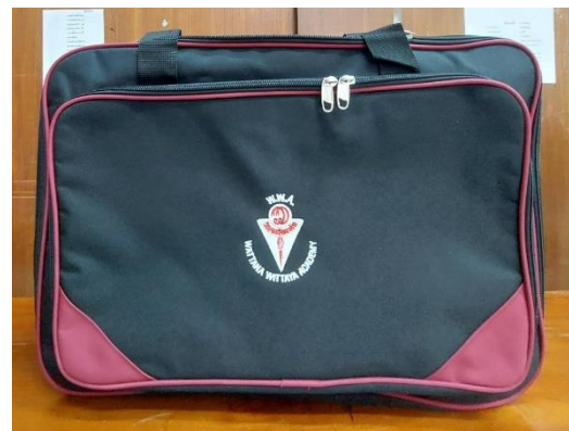
กระเป๋าใส่เสื้อผ้า