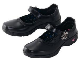
รองเท้านักเรียนสีดำ