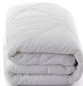
ผ้าห่ม (ขนาดเตียง 3 ฟุต)