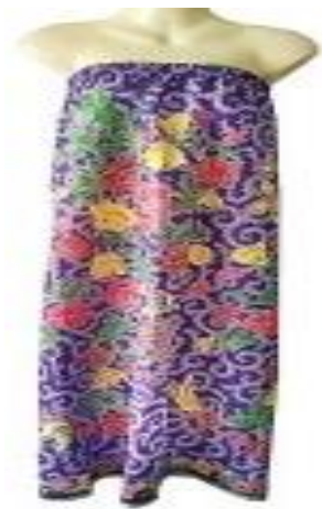
ผ้านุ่งอาบน้ำ