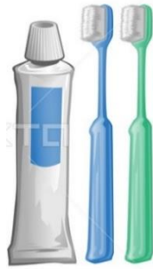
ยาสีฟัน แปรงสีฟัน