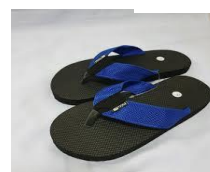
รองเท้าฟองน้ำ