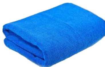
ผ้าเช็ดตัวขนาดกลาง