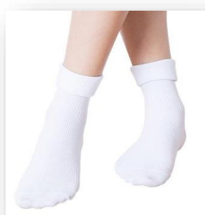
ถุงเท้าสีขาวพับ