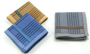
ผ้าเช็ดหน้า