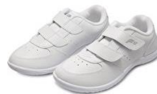
รองเท้าพละ