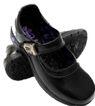
รองเท้านักเรียน