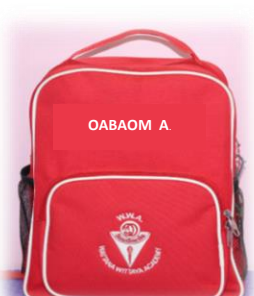
กระเป๋านักเรียน