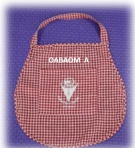
ผ้ากันเปื้อน