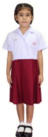
ชุดนักเรียนหญิง