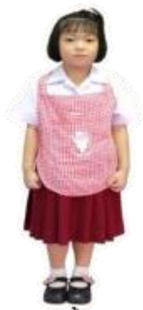
ชุดนักเรียนอนุบาล 1