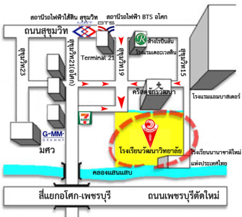
แผนที่ 1 สถานที่ตั้งโรงเรียนวัฒนาวิทยาลัย