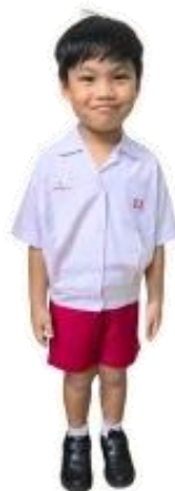
ชุดนักเรียนชาย