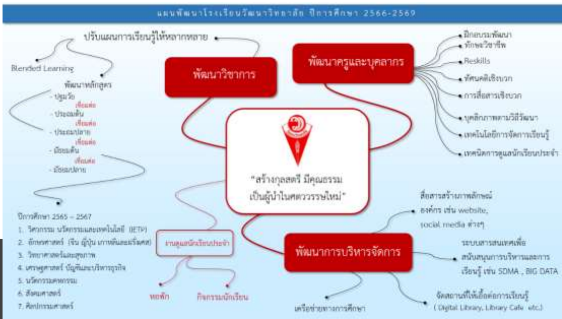
แผนภาพที่ 2 แผนพัฒนาโรงเรียนปีการศึกษา 2566 - 2569

จัดทำแผนพัฒนาโรงเรียนด้านวิชาการ การพัฒนาครูและบุคลากร รวมถึงการบริหารจัดการเพื่อสนับสนุน ส่งเสริมการจัดการเรียนรู้ให้กับเด็กและผู้เรียนอย่างเต็มศักยภาพ ดังแผนภาพที่ 2